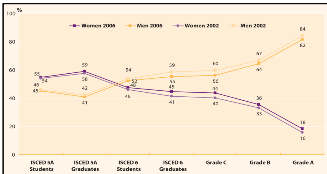
Figura 1: Proporción de mujeres y hombres en una carrera típica universitaria en 27 Estados Miembros de la UE, 2002-2006. Fuente: Estadísticas Europeas (Eurostat); WiS database (DG Research)